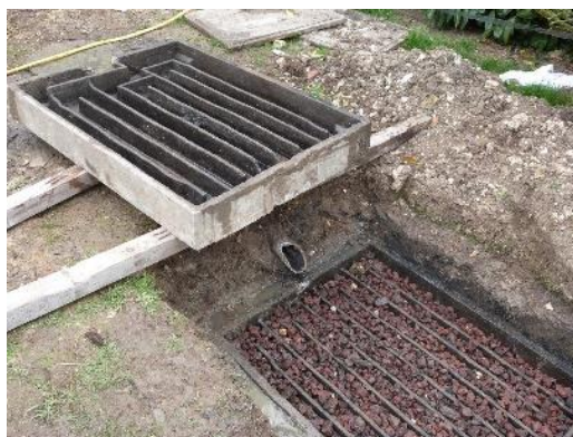
Filtre épurateur à cheminement lent