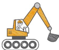
Entreprise du BTP