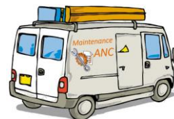
Professionnels de l'entretien

Ces entreprises s'engagent au respect d'engagements garantissant leurs bonnes pratiques et la qualité de leurs interventions.